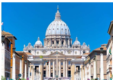
Basílica de São Pedro Vaticano

Turismo em Roma com Guia em ônibus por sete horas- parada para almoço patrocinado