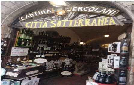
Cidade subterrânea em Montepulciano