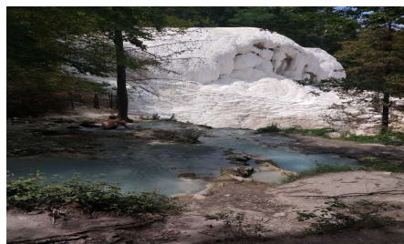
Bagni de San Felippo