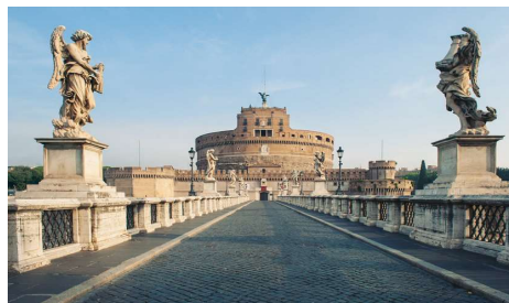
Castelo de Sant'Angelo